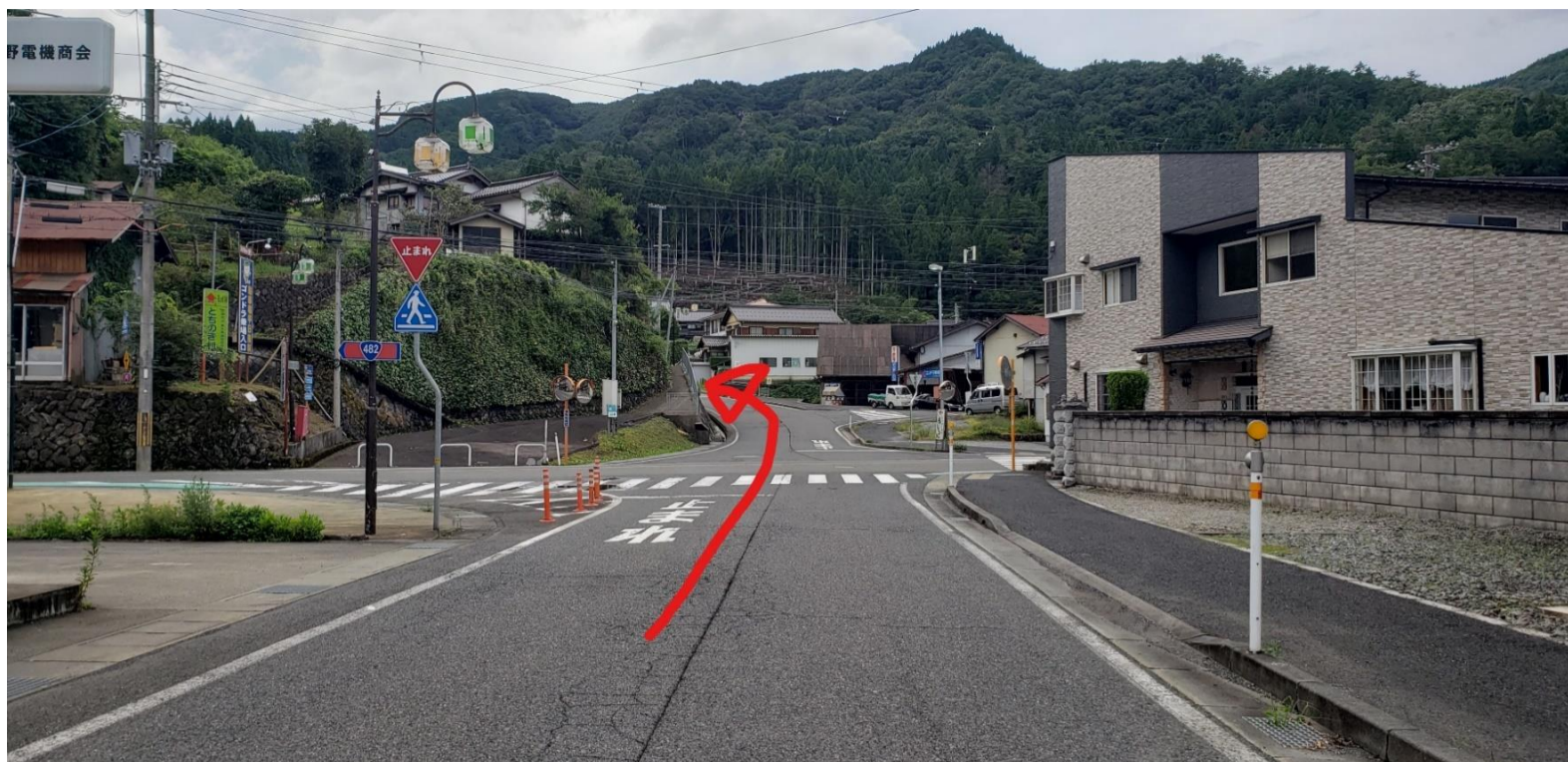
④ 十字路を直進(注：一時停止線あり)