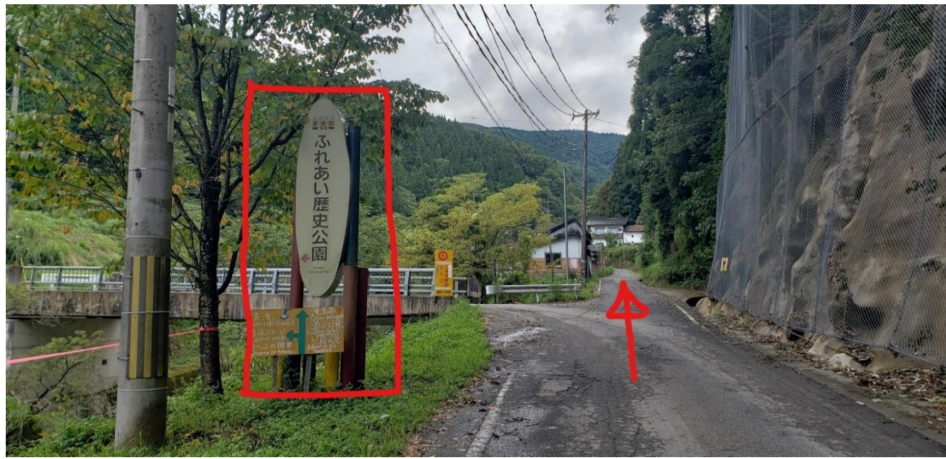
⑦ふれあい歴史公園の看板を直進