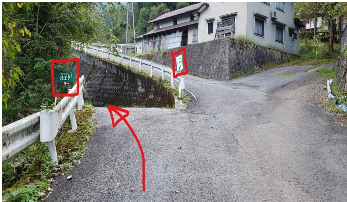
⑧Y字路を左折(滝見亭の看板あり)