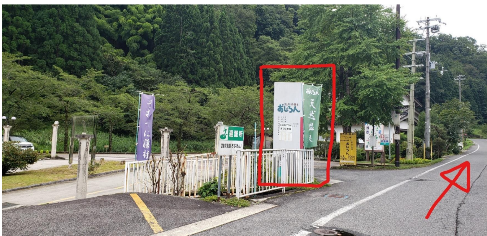
⑤ 小代(オジロ)温泉「おじろん」(左手)を直進