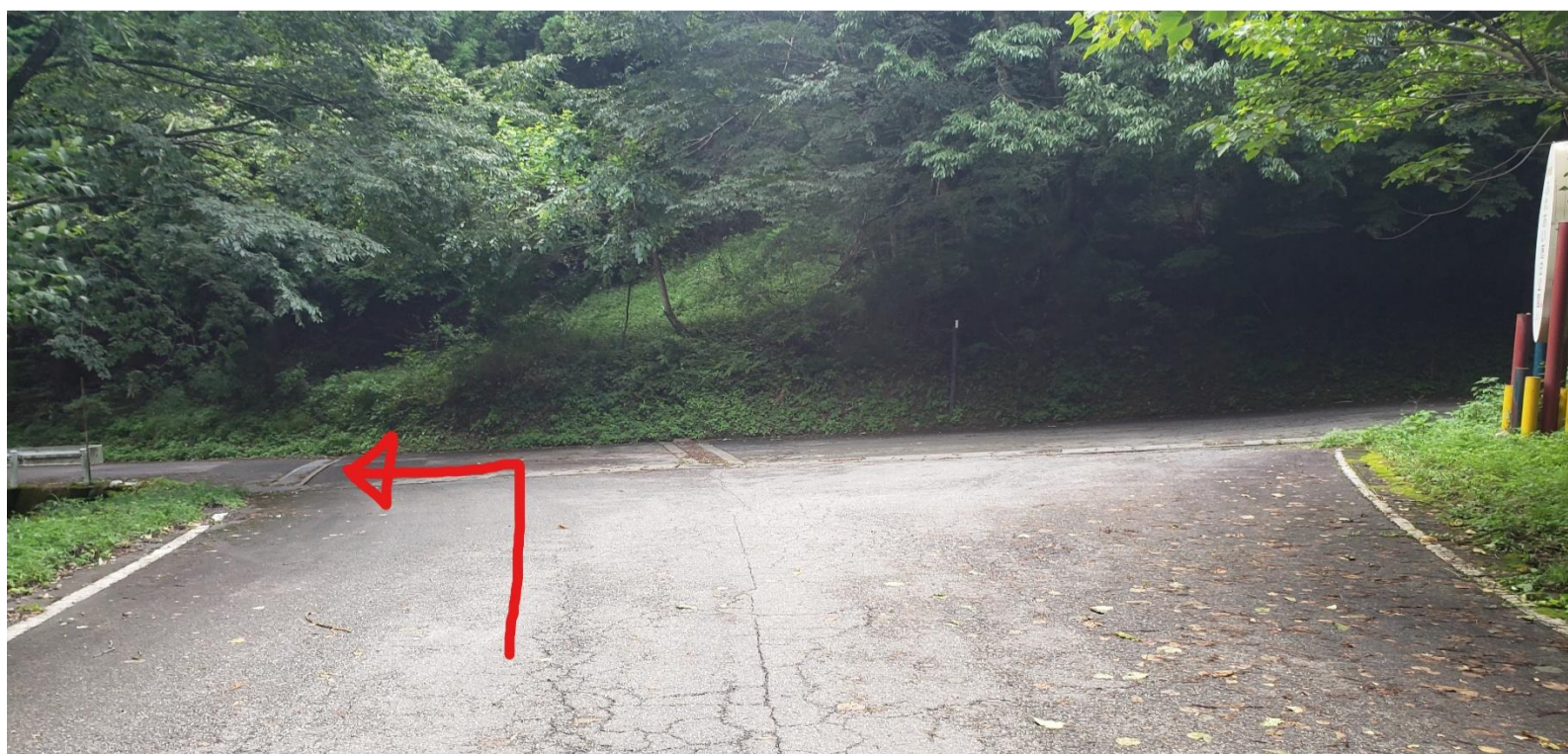
⑨突き当たりを左折