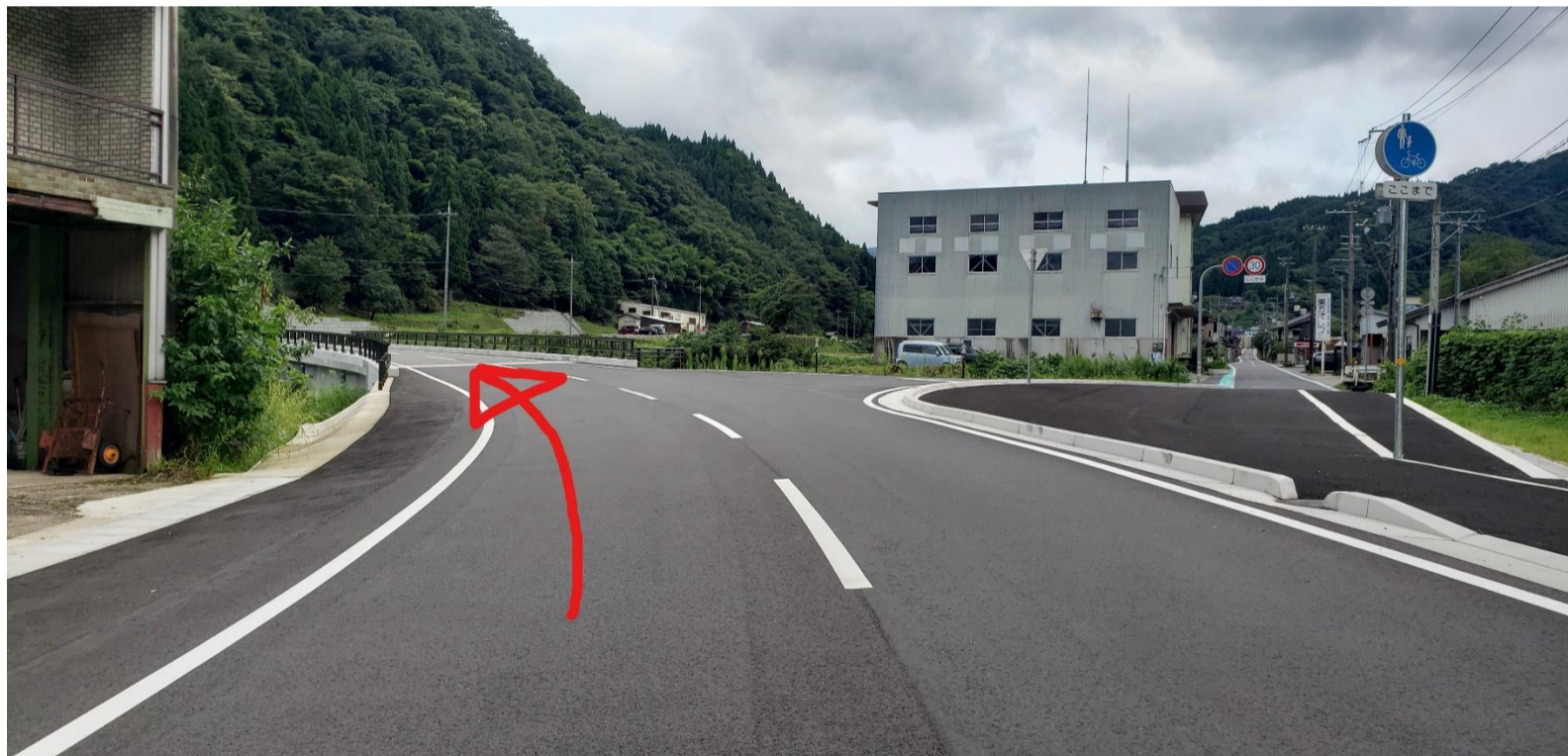
②小代バイパス直進(左カーブ)