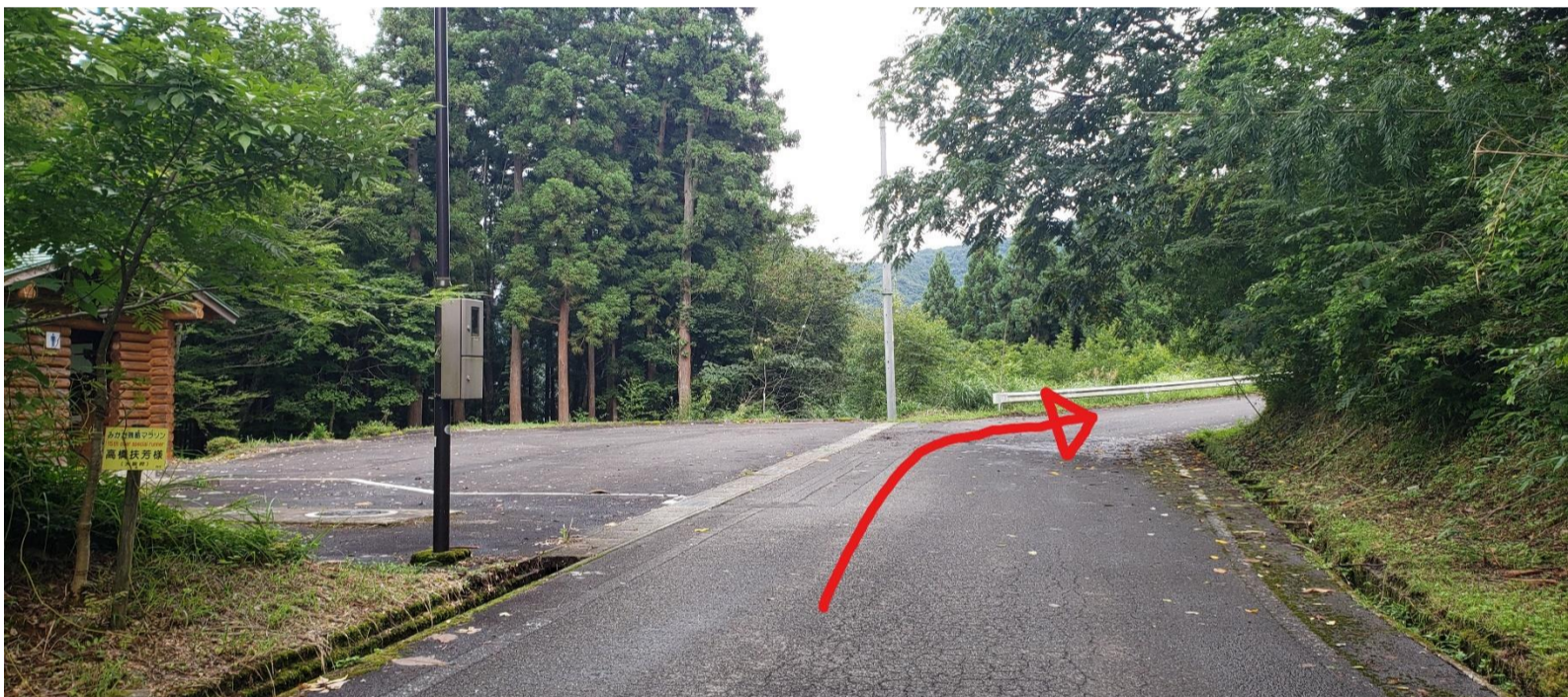
⑧ふれあい歴史公園駐車場(左側公衆トイレあり)を直進