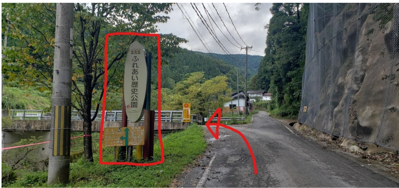
⑦ふれあい歴史公園看板を左折(橋あり)