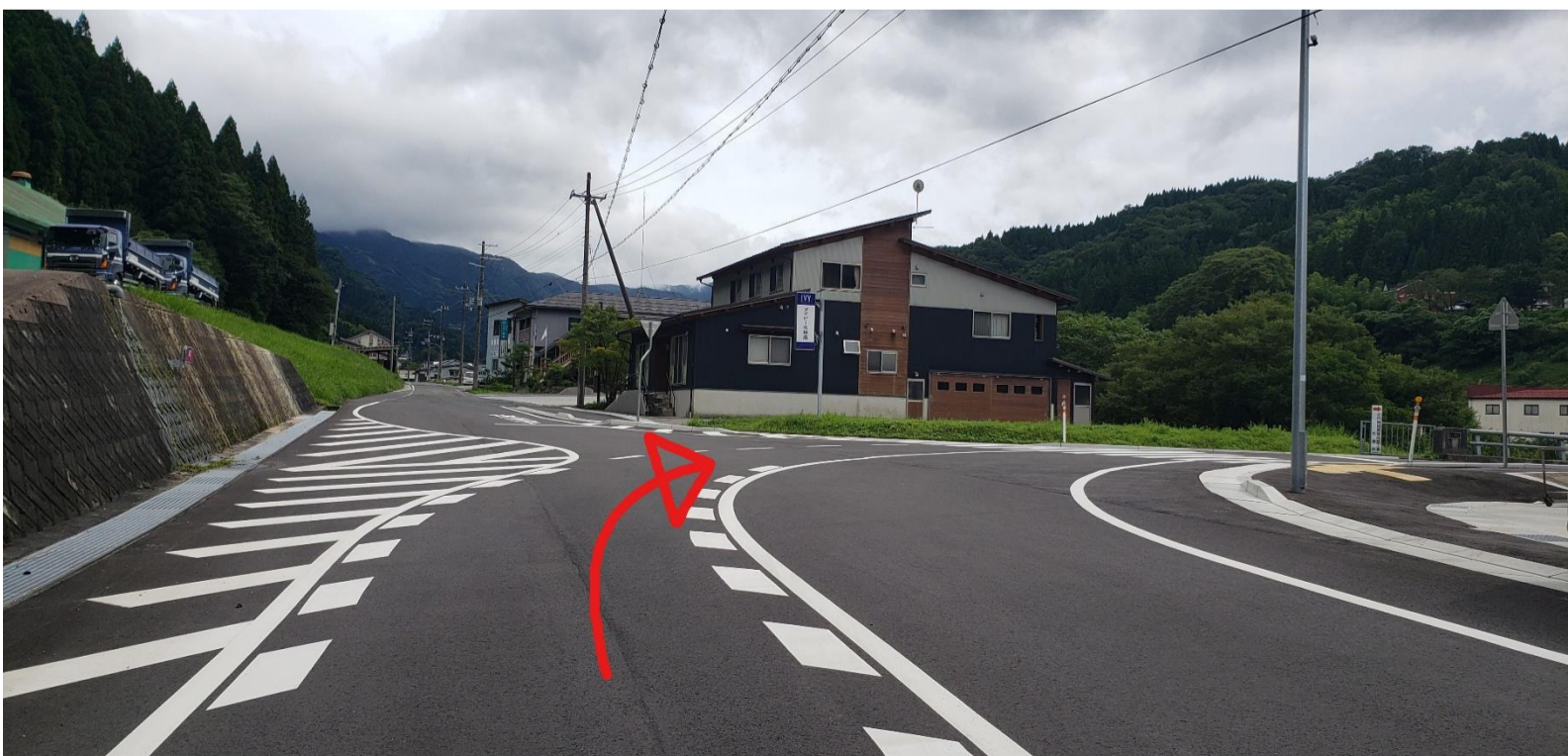
③大きい道に沿って進む(右カーブ)