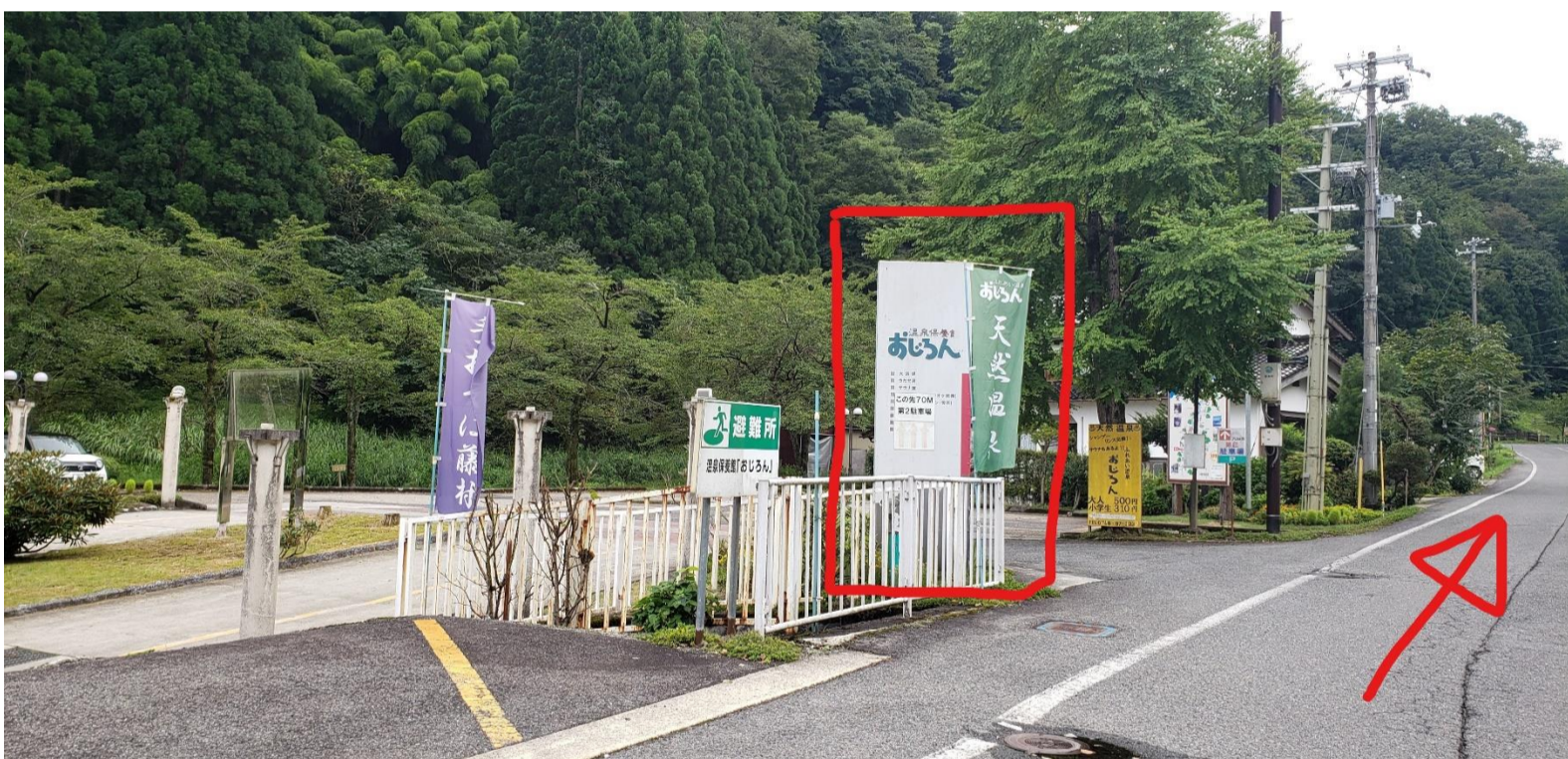
⑤小代(オジロ)温泉「おじろん」(左手)を直進