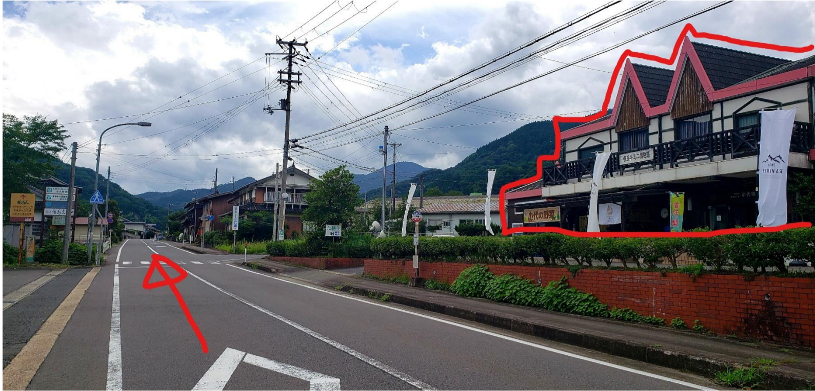
①香美町小代観光協会・小代物産館前を直進