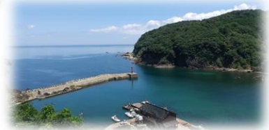
隣の鎧(よろい)駅 からも絶景が →