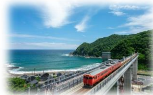
← 高さ41mの浮遊感を 列車から